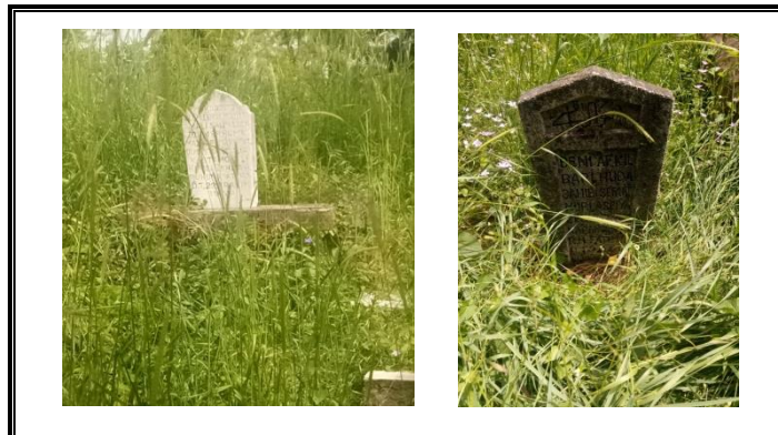
Resim 6. Dua Metinleri ve Af Dilenmeyle İlgili Metinler

Dua metinleri ölü yakınlarının, kaybettikleri kimseler için ettikleri duaları toplumla paylaşma yöntemidir ve bunları okuyanların da aynı duayı ölülerinin ruhlarına yollamalarını sağlayarak duayı çoğaltma arzularının sonucudur. Af dilenme ile ilgili metinlerde ise insanoğlunun kusursuz olmadığı ve gaflete düşebileceği gerçeği hatırlatılarak, günahların affedilebilmesi için yakarışlarda bulunulur. Bu metinler, içten yakarışlar olmakla beraber aynı zamanda toplumsal bilinçaltının günahkârlıktan korunma konusunda hayatını kaybetmiş kimseler aracılığıyla topluma vermiş olduğu mesajlardır. Buradaki bir başka niyet de Allah'ın affediciliğini vurgulamaktır denilebilir.