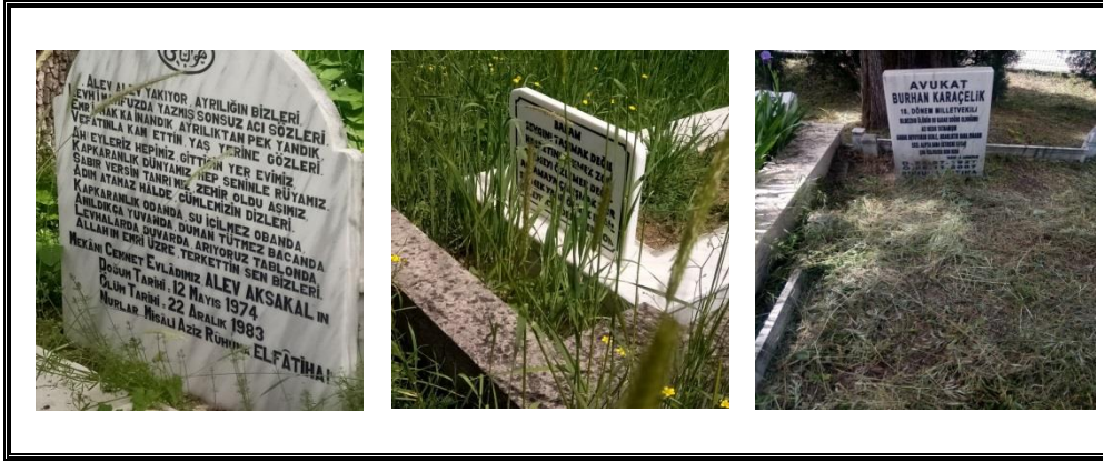
Resim 3. Özlem Konusunu Ele Alan Metinler

Daha çok mezarda yatan kişilerin yakınlarının ağzından yazılan ve yaşamakta olanların ölüm karşısındaki çaresizliği ile bu çaresizliğin doğurduğu yoğun özlem hissini öne çıkaran, bu hissi vurgulayan metinlerdir. Bu tarz metinlere Bartın mezarlıklarında sıklıkla rastlanır.