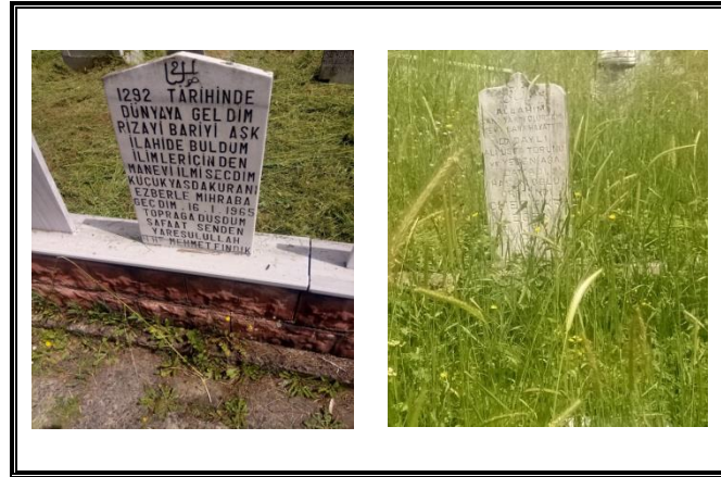
Resim 7. Dinî -Tasavvufî Yaşantıyı Vurgulayan Metinler

Bu metinler, mezarda yatan kişinin yaşarken Allah yolunda olduğunu, öldükten sonra da Allah'a yakın olmayı amaçladığını vurgular. Bu vurgulamalar yapılarak toplumsal bilinçaltı harekete geçirilmek istenmekte ve söz konusu ölümler için bireylerden dua talep edilmektedir. Aynı zamanda bu metinler, ahiret hayatı için peygamberden şefâat, Allahtan da af dilemeye aracı olurlar.