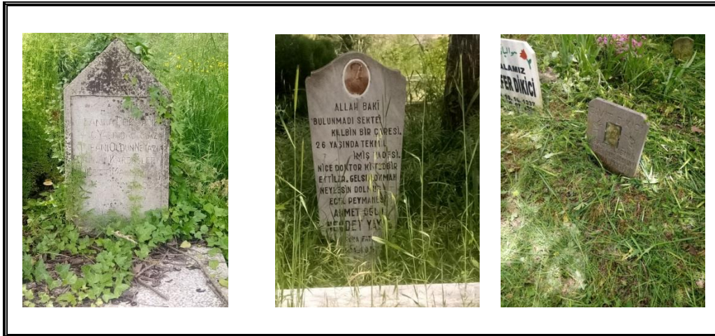
Resim 2. Ölüm Sebebini Vurgulayan Metinler

Türk toplumsal bilinçaltının ürettiği bazı metinler mezarda yatan kişinin ölüm sebebinden söz ederek, ziyaretçide merhamet duygusu uyandırmayı, ölüyle yaşayanlar arasında zihni ve kalbi bağlar oluşturup müteveffanın artık soyut bir hal almış varlığını biraz olsun somutlamayı amaçlar.