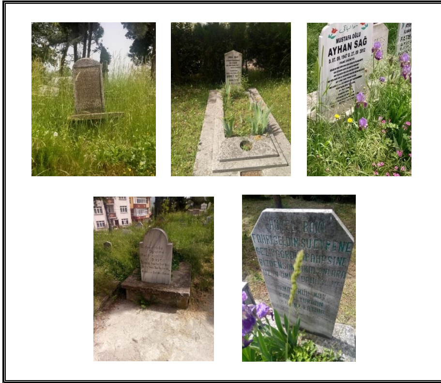
Resim 1. Ömrün Faniliği, Ölümün Kaçınılmazlığını Vurgulayan Metinler