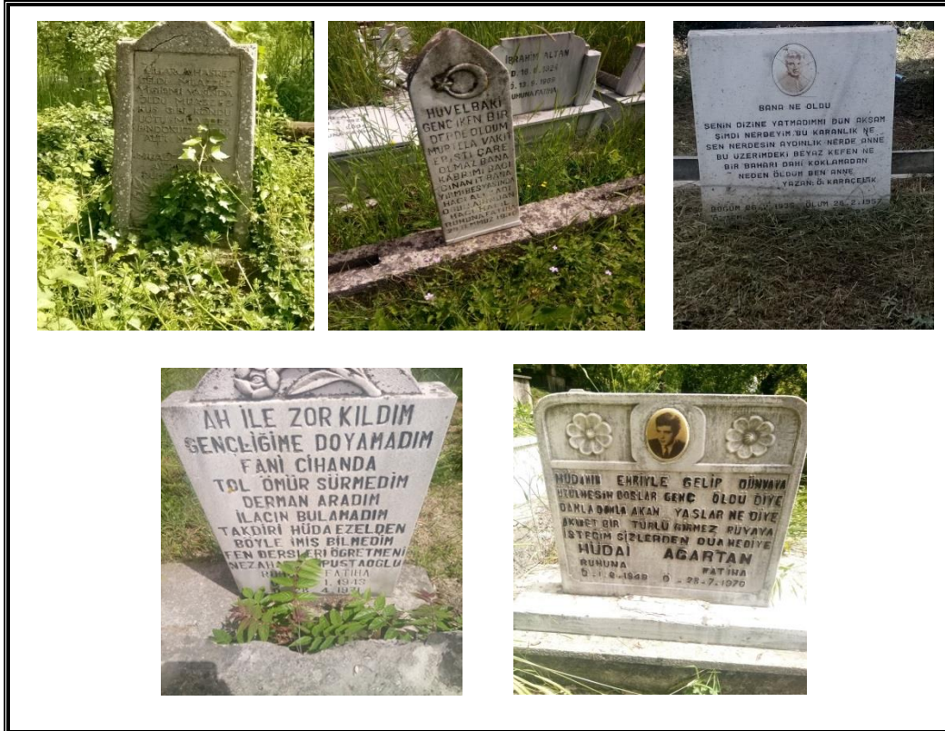
Resim 4. Erken Gelen Ölüm Hakkındaki Metinler

Genç yaşta kaybedilenler toplum hafızasında derin ve acı izler bırakır. Toplumsal bilinçaltı ölümü genç insanlara yakıştıramaz. Genç bir kimsenin vefatına duyulan acı yoğun ve ortaktır. Konu hakkındaki mezar taşı metinleri bu hisdaşlığın ortaya çıkardığı anlaşılabilirlikten yararlanarak acıyı paylaşarak azaltmaya çalışmanın bir sonucu şeklinde ortaya çıkmıştır.