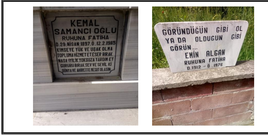
Resim 5. Nasihat Niteliğindeki Metinler

etkin bir biçimde sağlayabileceğinin farkındadır. Bu öğütler ziyaretçilerce okundukça, ölünün toplumuna bıraktığı umumî bir miras hüviyetine bürünürler.